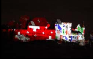
83. Delegiertenversammlung ZTPV 2010 Lenzburg

Genehmigung des Protokolls der 82. Delegiertenversammlung vom 14. März 2009 in Rothrist