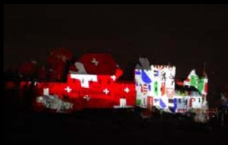
83. Delegiertenversammlung ZTPV 2010 Lenzburg