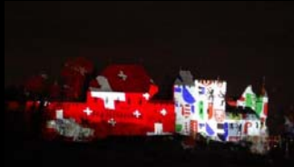
83. Delegiertenversammlung ZTPV 2010 Lenzburg