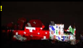
83. Delegiertenversammlung ZTPV 2010 Lenzburg